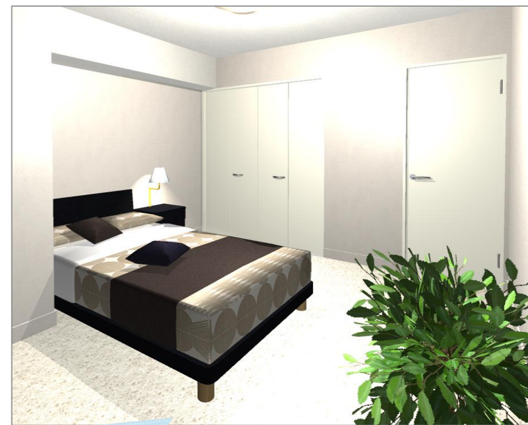
Room2 After Image