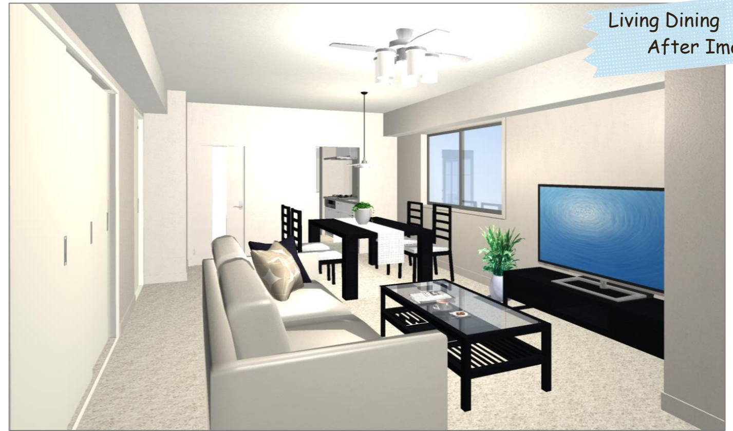
Living Dining After Image

カーペットやクロス、建具を一新することで、新築のような見た目に。コーディネートする素材やカラーによって高級感のある空間を演出することができます。